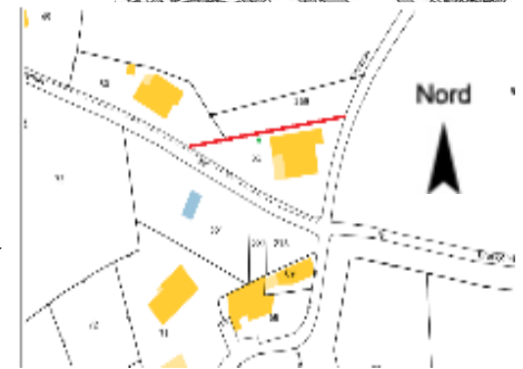
Projet d'installation d'une clôture